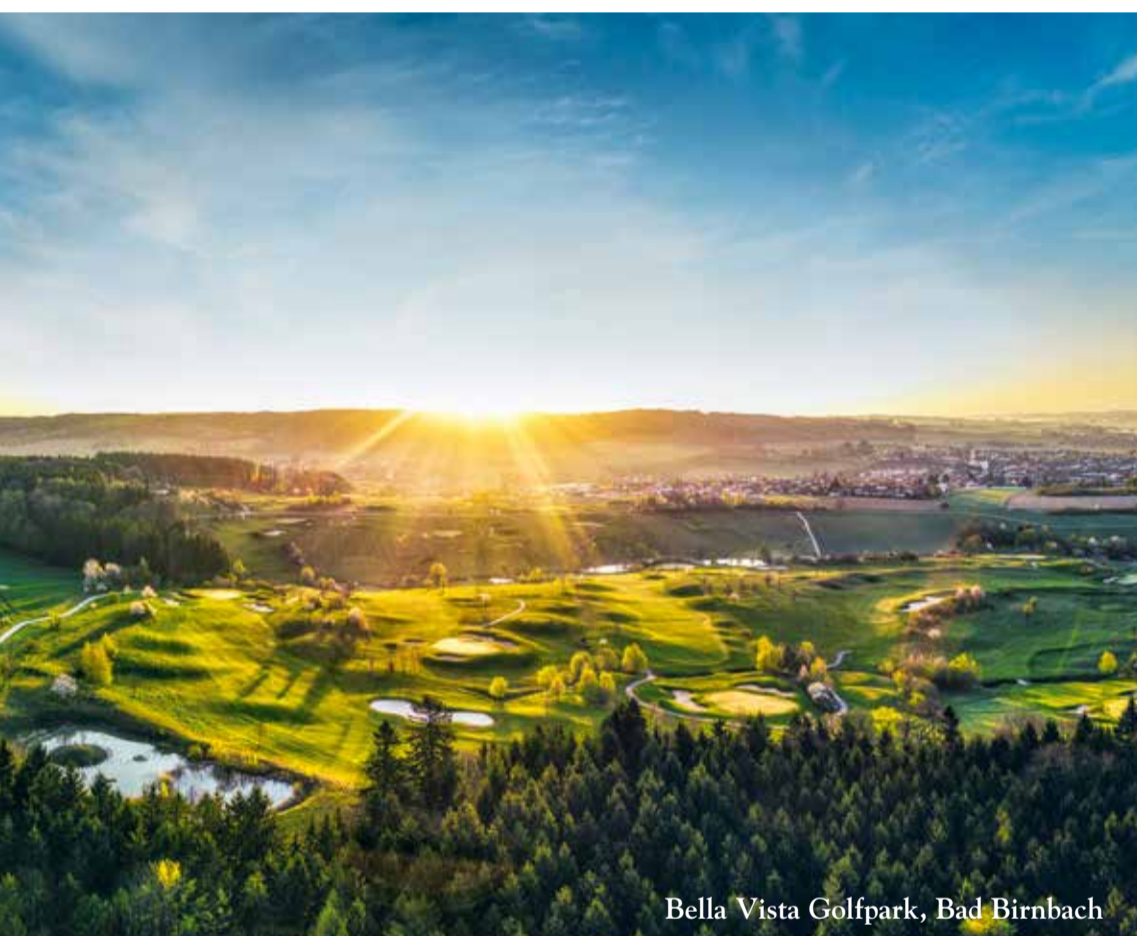
Bella Vista Golfpark, Bad Birnbach

14 Nächte pro Person im DZ € 995,- | DZ-XXL € 1100,- Komfort-DZ € 1065,- | EZ € 1100,-